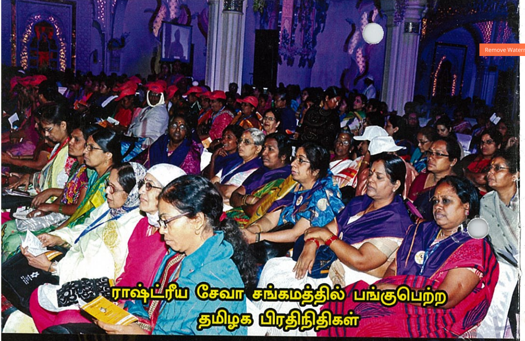
ராஷ்ட்ரிய சேவா சங்கமத்தில் பங்குபெற்ற தமிழக பிரதிநிதிகள்