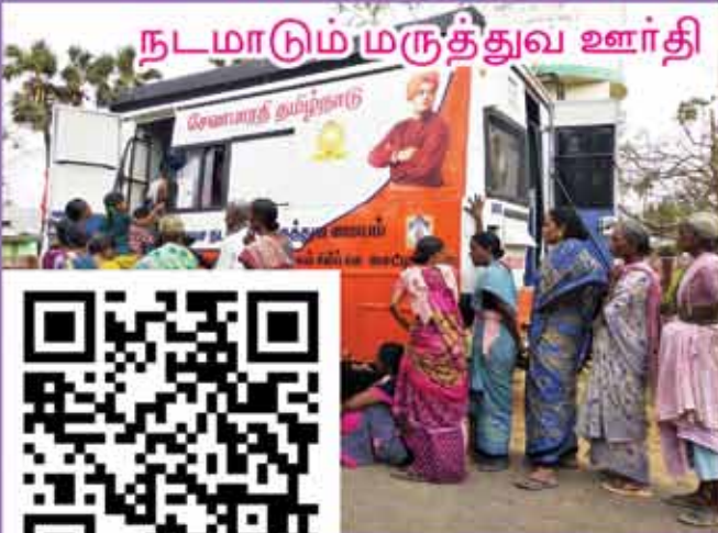
நடமாடும் மருத்துவ ஊர்தி