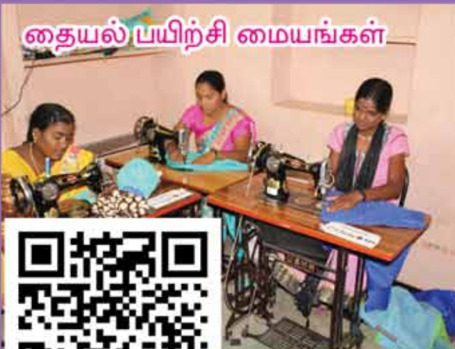
தையல் பயிற்சி மையங்கள்