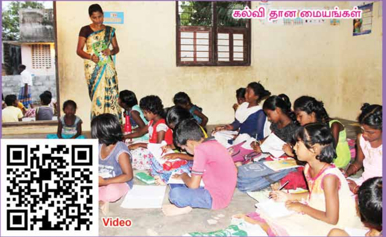
கல்வி தான மையங்கள்